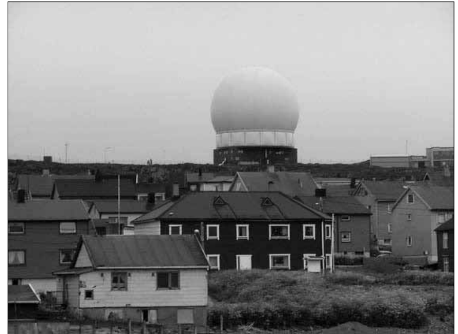
Vardö radaranläggning i Nordnorge.

Next year a joint statement will be signed. Norwegian Foreign Minister Jonas Gahr Støre stated: “ This is an important step in the right direction. ” A week later defense ministers of Britain, Denmark, Finland, Iceland, Norway, Sweden, Estonia, Latvia and Lithuania met in Oslo. Liam Fox Brit-